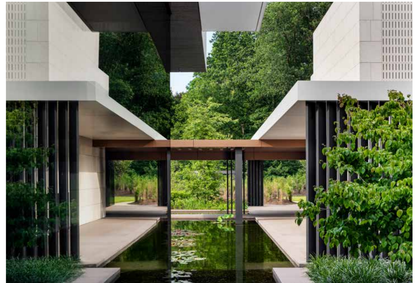
De många dammarna förstärker kopplingen till naturen.

“MED SINA NEDTONADE OCH ANINGEN STRIKTA FORMER HAR HUSET TYDLIGA INSLAG AV MINIMALISM, MEN DEN KYLA SOM EMELLANÅT BRUKAR FÖRKNIPPAS MED STILEN LYSER MED SIN FRÅNVARO.”