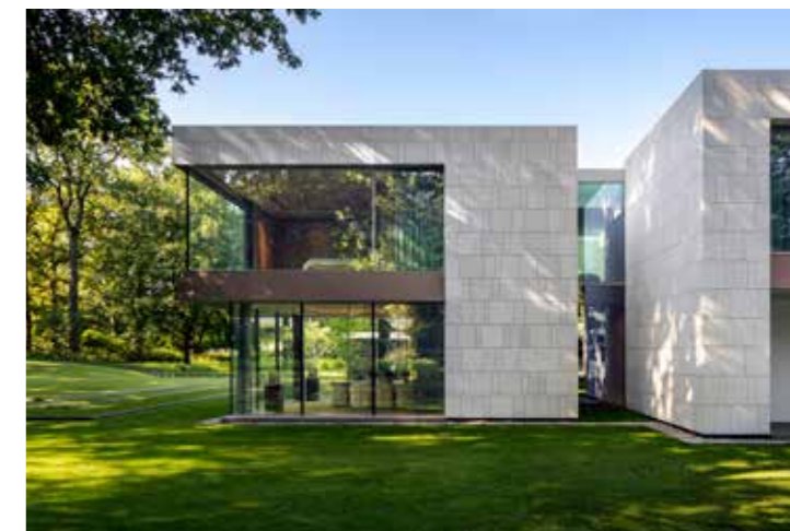
Dagsljuset flödar genom husets enorma glaspartier.

ETT AV DERAS senaste projekt ligger i Belgien, närmare bestämt i regionen Flandern, som också gett huset dess namn. Med nyligen färdigställda Flanders House var målet att skapa en harmonisk samexistens mellan arkitektur och natur. Det har uppnåtts på flera sätt, bland annat genom genialt placerade grönskade innergårdar och en intrikat strukturerad layout av koi-dammar. Och – inte minst – tack vare en smält förtrollande swimmingpool.