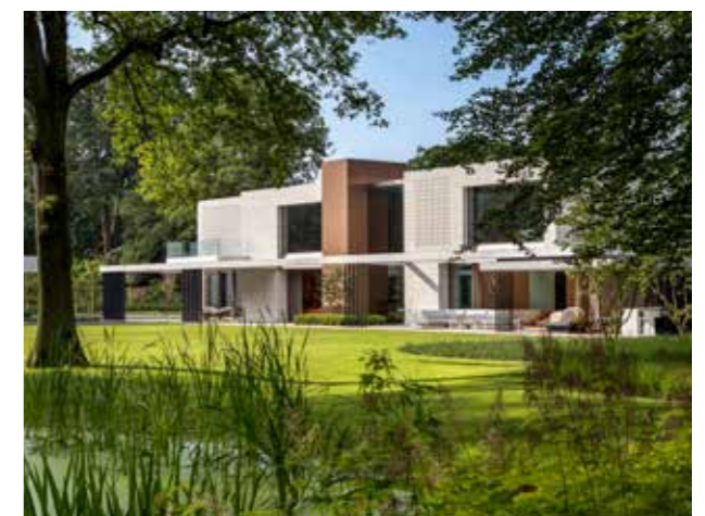
Huset präglas av rena och raka linjer.

DET SISTNÄMMDA står helt klart i fokus i Flanders House, som är ett hem vikt åt avkoppling, samvaro och harmoni. Med sina nedtonade och aningen strikta former har huset tydliga inslag av minimalism, men den kyla som emellanåt brukar förknippas med stilen lyser med sin frånvaro. Det här är ett ställe som utstrålar värme och hemtrevlighet.