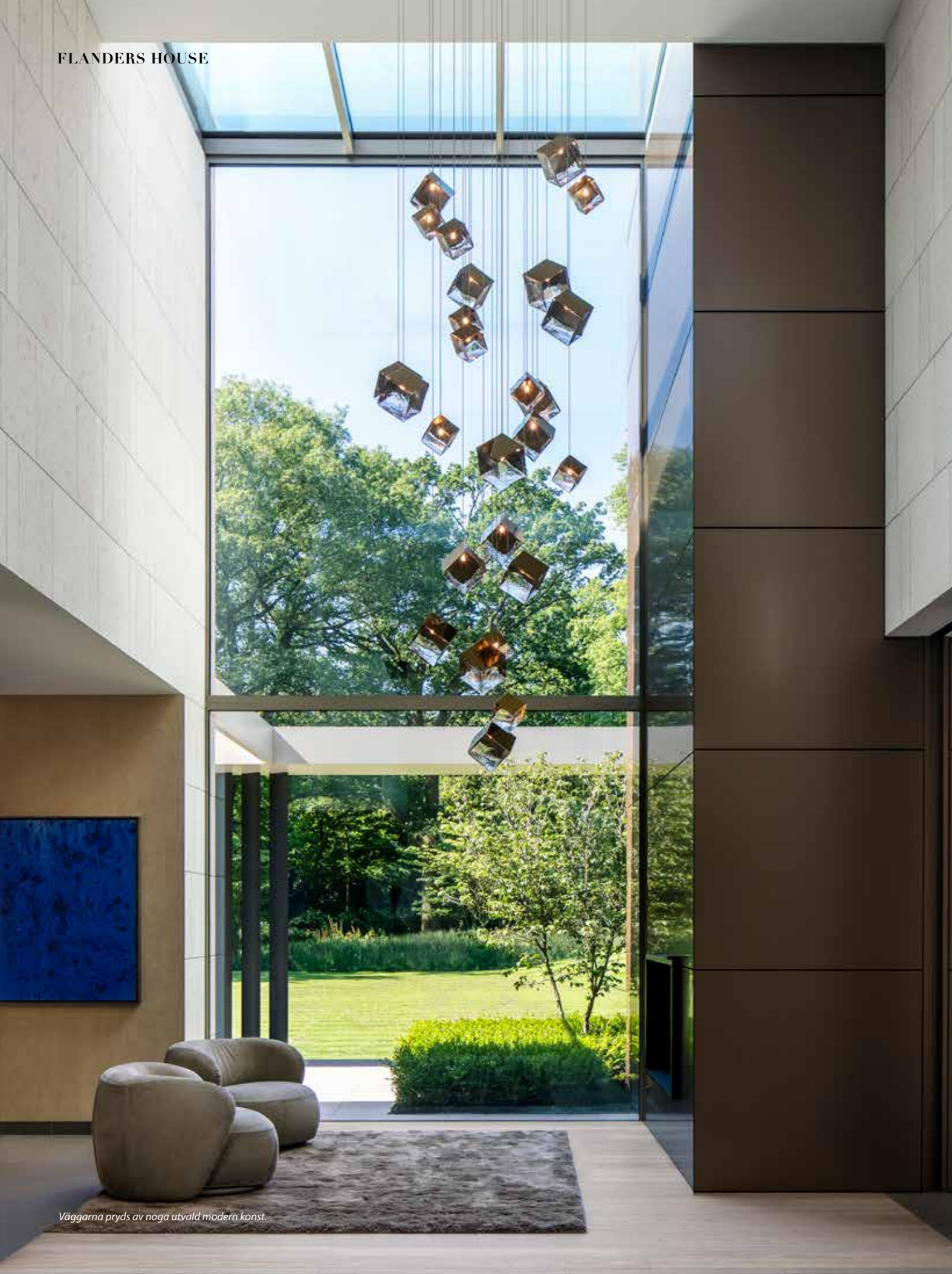
Väggarna pryds av noga utvald modern konst.