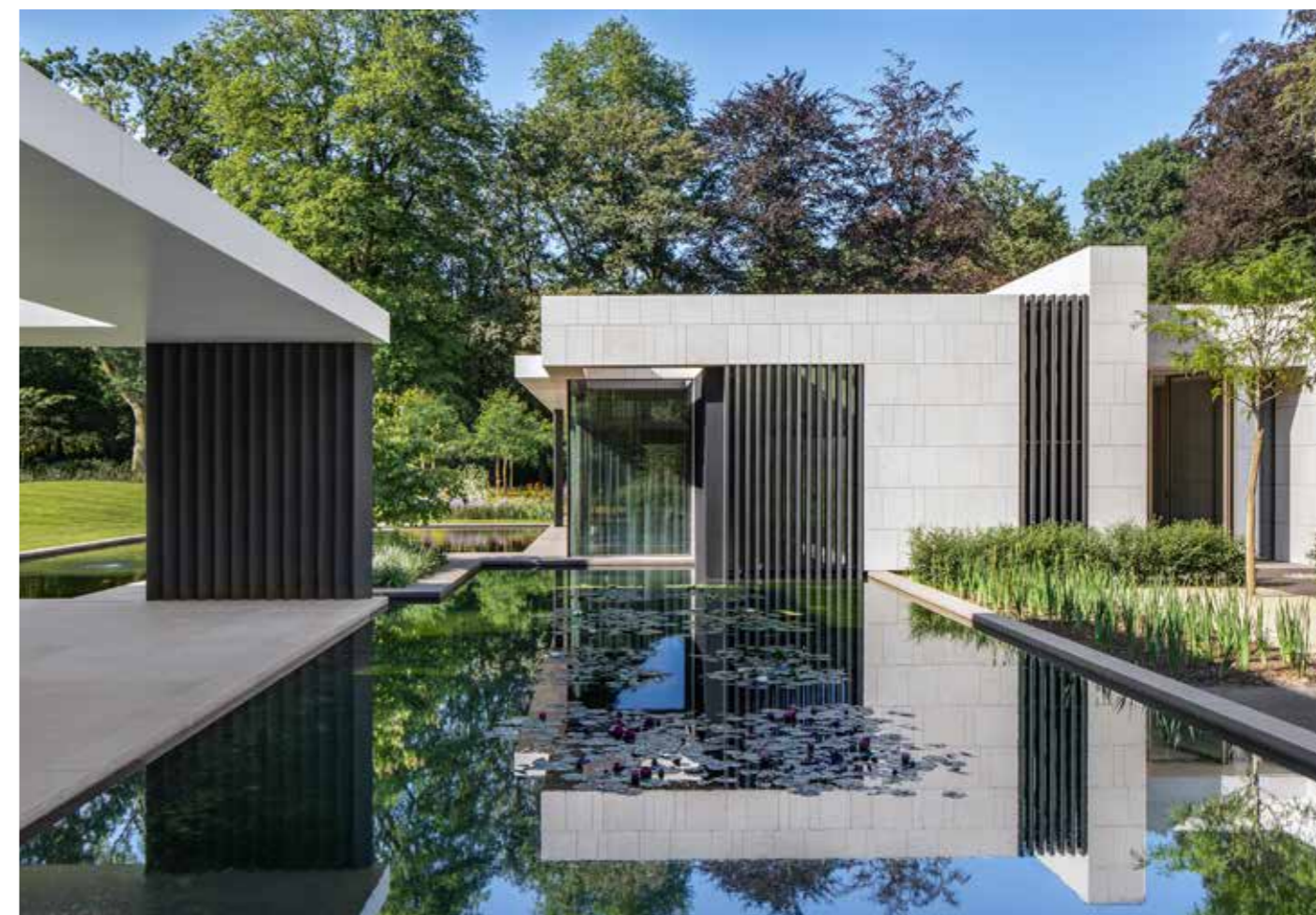
Poolen, som ligger mellan bostadshuset och kontoret, blir en tydlig gräns mellan fritid och arbete.